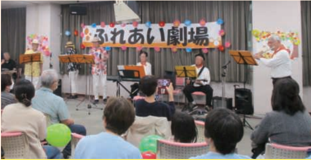
大迫力の舞台発表

笑顔いっぱいの交流が広がり、「あたたかい」たたずまいにつつまれた1日となりました。