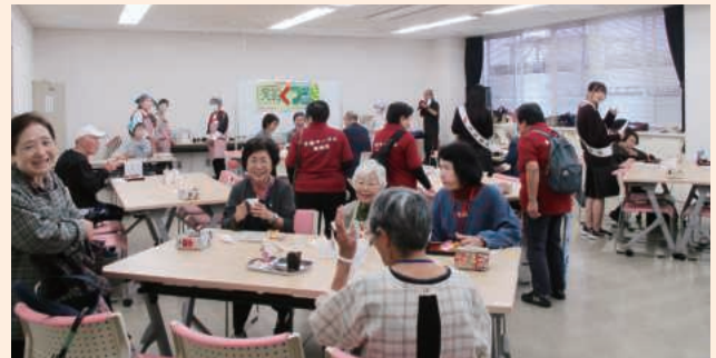
喫茶コーナーでひといき