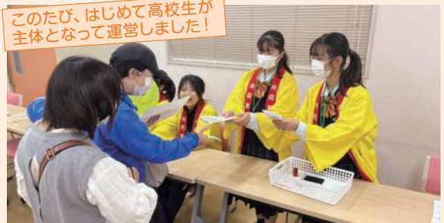
赤い羽根共同募金の啓発