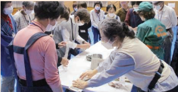
体験してわかる「災害時の備え」