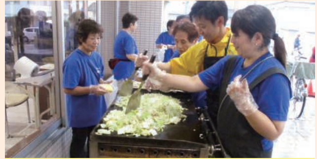
味もところもあたたかい模擬店